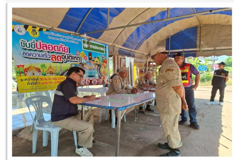
หน่วยงานรับผิดชอบ สำนักปลัด