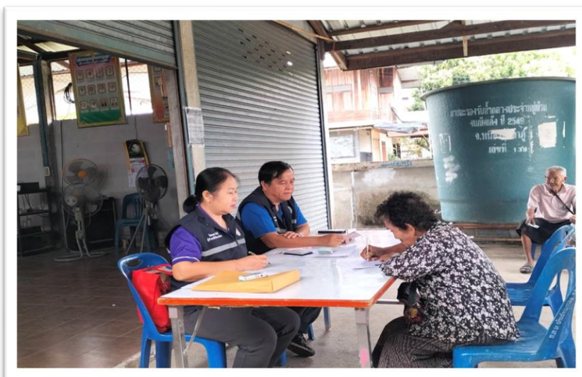
หน่วยงานรับผิดชอบ กองสวัสดิการสังคม