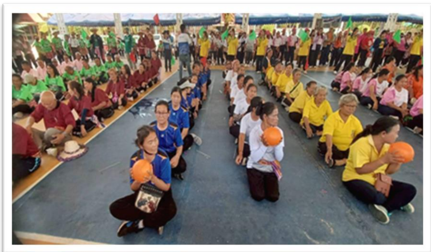
หน่วยงานรับผิดชอบ กองสวัสดิการสังคม