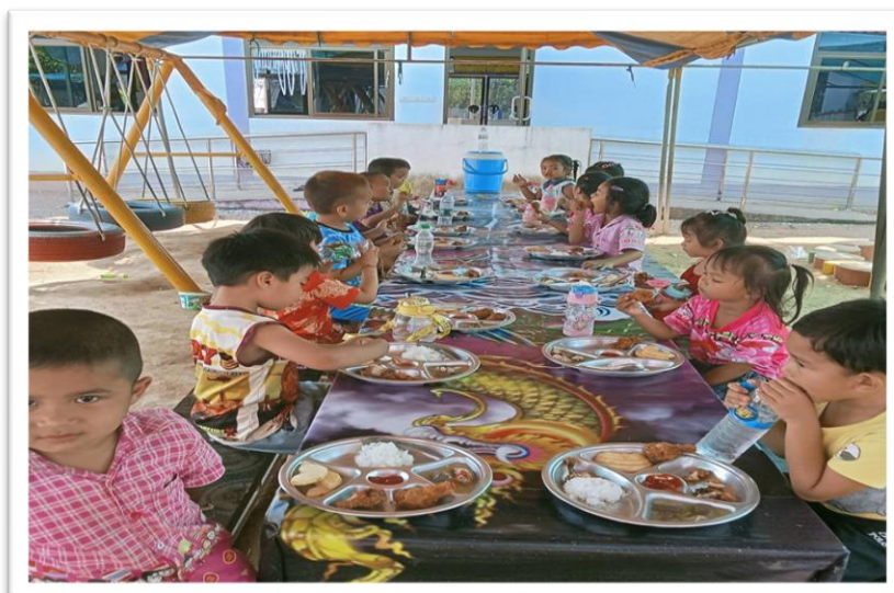
หน่วยงานรับผิดชอบ กองการศึกษา ศาสนาและวัฒนธรรม