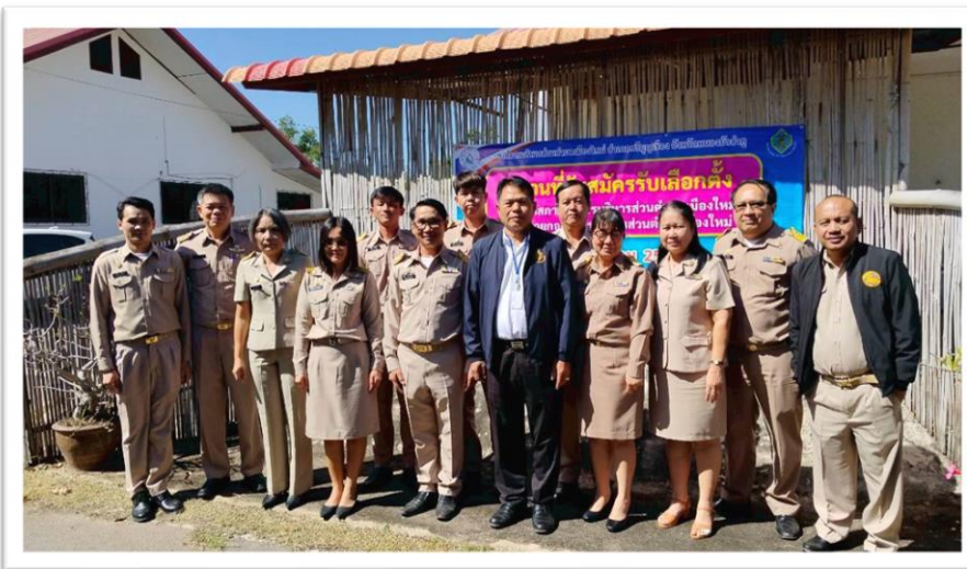
หน่วยงานรับผิดชอบ สำนักปลัด