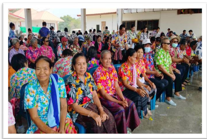
หน่วยงานรับผิดชอบ กองสวัสดิการสังคม