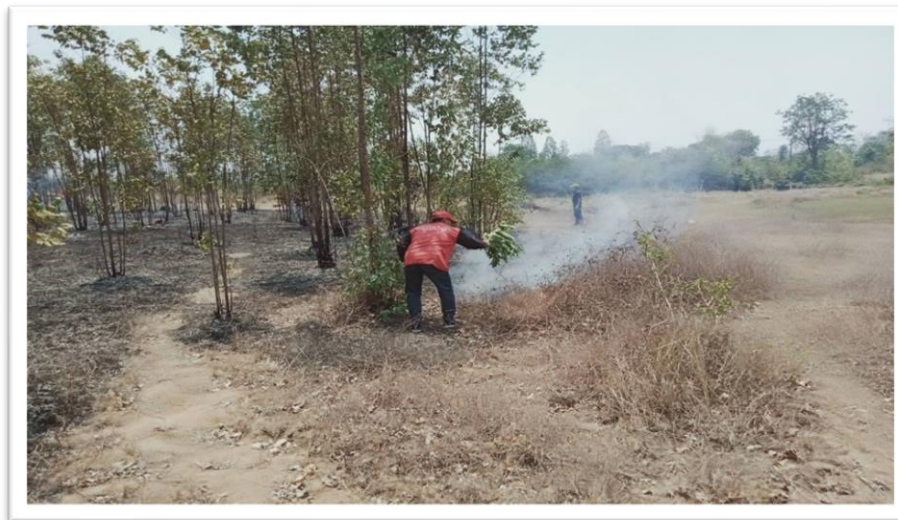
หน่วยงานรับผิดชอบ สำนักปลัด