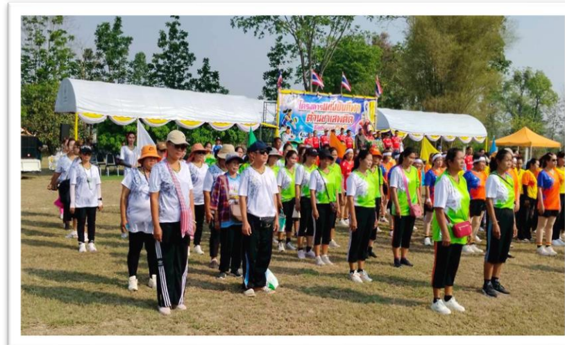
หน่วยงานรับผิดชอบ กองการศึกษา ศาสนาและวัฒนธรรม