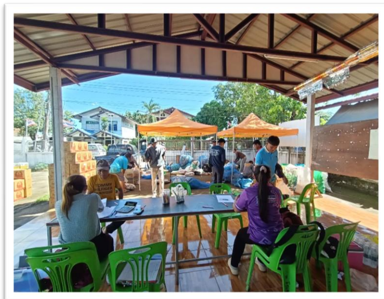
หน่วยงานรับผิดชอบ สำนักปลัด